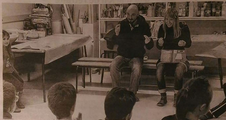
Tous les enfants des écoles de Cerizay bénéficient de l'éducation artistique. Le spectacle sera présenté le 22 janvier.

L'éducation scolaire, c'est aussi l'éducation artistique. C'est en tout cas la vision de la ville de Cerizay qui, depuis le mois de septembre, a introduit dans les écoles, aussi bien dans les établissements publics que privés, des cours d'éducation artistique.