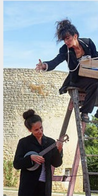
CHUT(É) ! Art de la rue Tout public 50 minutes