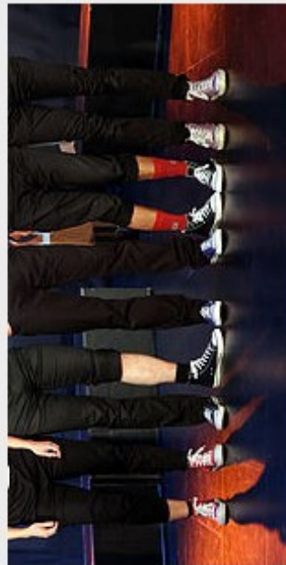
BALBU'SIGNES BALBU'SONS Concert signé-décalé A partir de 2 ans 40 minutes