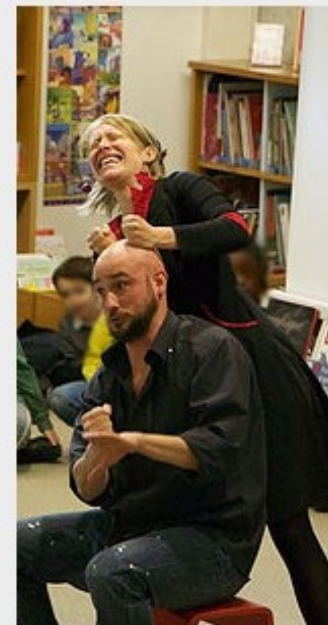
CONFITURES DE PAPIER Histoires signées - Musique A partir de 1 an 20 à 35 minutes