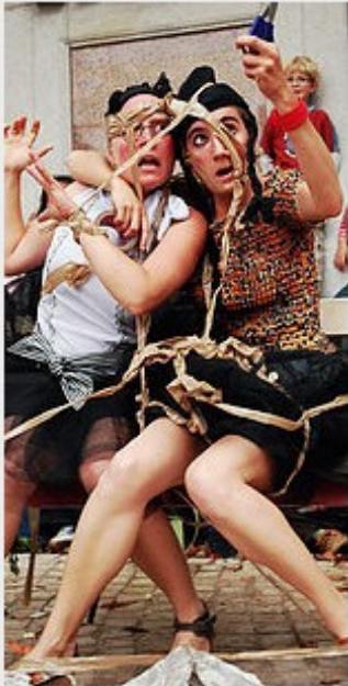
SANS VOIX Art de la rue Tout public 35 minutes