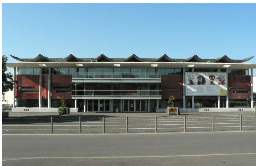
Place de la République - ST MEDARD EN JALLES (33)