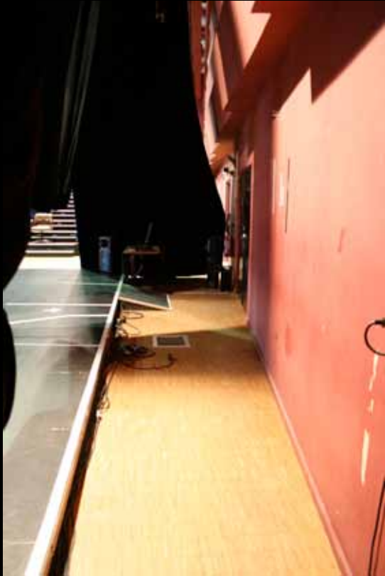
Vue du fond de scène