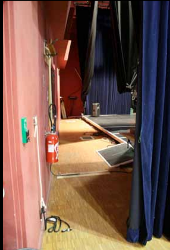
Vue du nez de scène