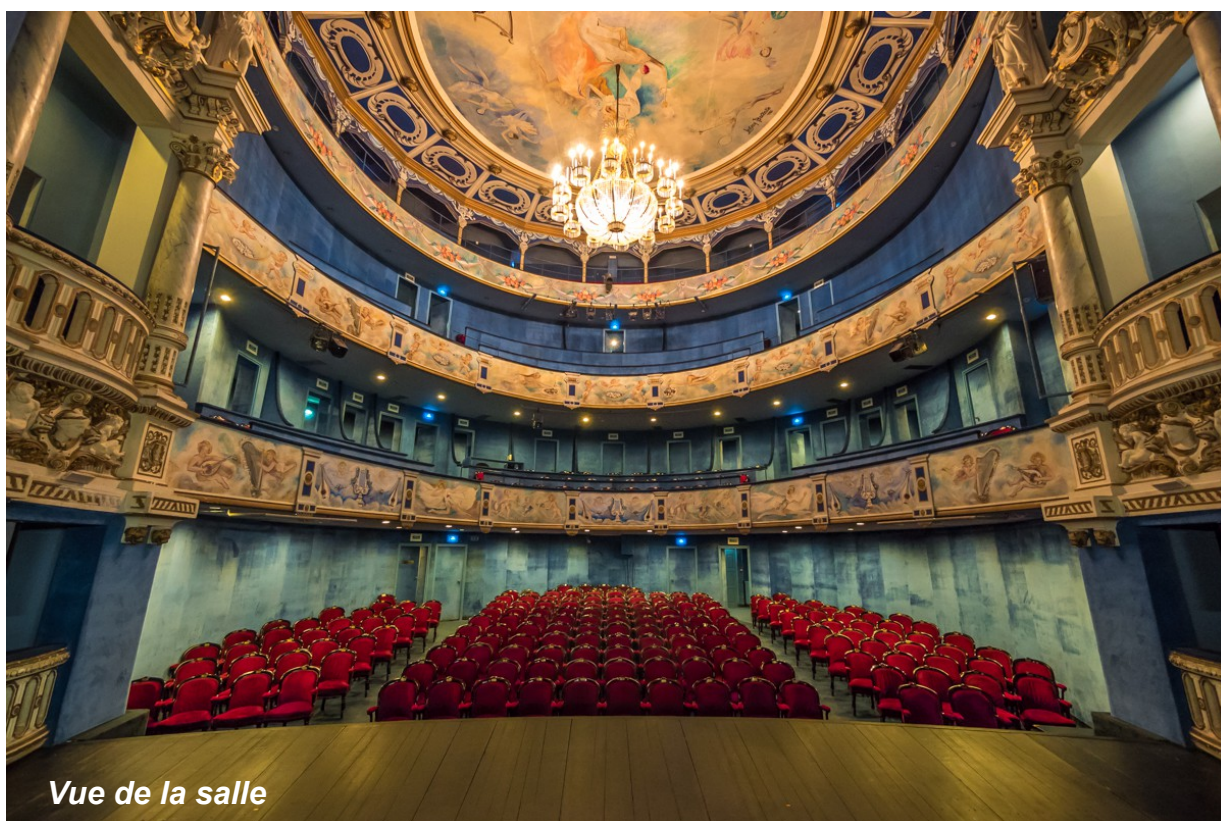
Vue de la salle