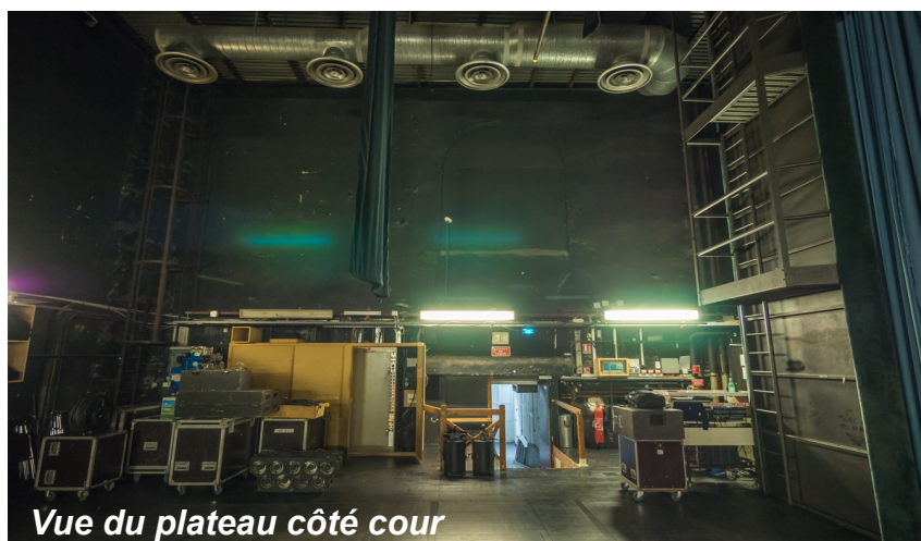
Vue du plateau côté cour