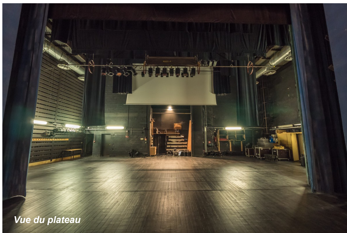
Vue du plateau