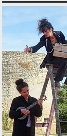
CHUT(e) ! Art de la rue Tout public 50 minutes