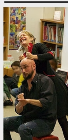
CONFITURES DE PAPIER Histoires signées - Musique A partir de 1 an 20 à 35 minutes