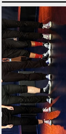
BALBU'SIGNES BALBU'SONS Concert signé-décalé A partir de 2 ans 40 minutes