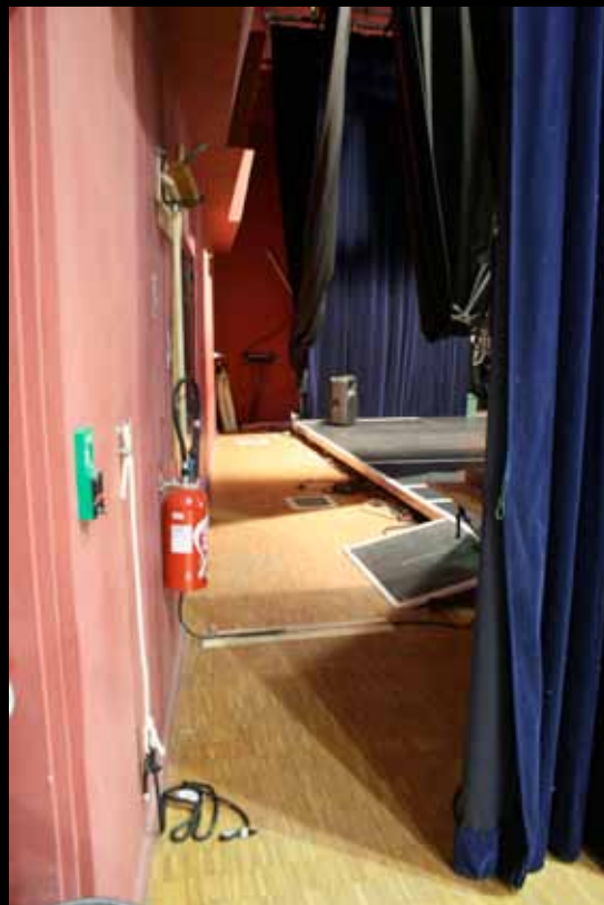
Vue du nez de scène