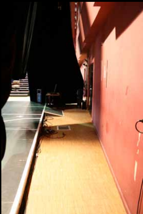
Vue du fond de scène