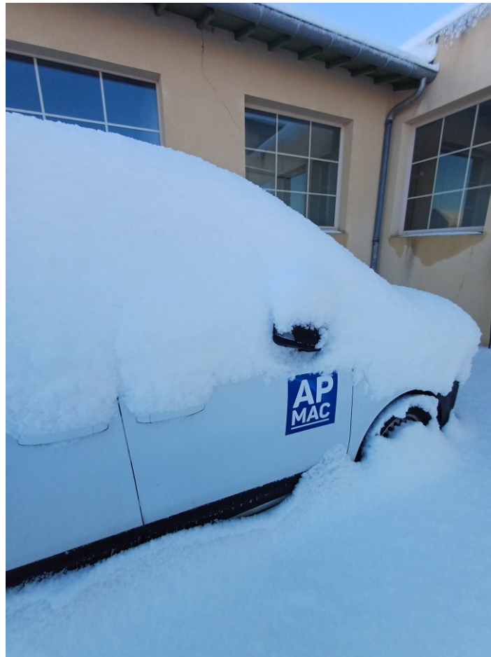
Avis de Grand Froid sur la culture ! i